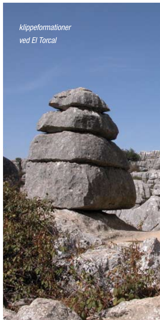
Klippeformationer ved El Torcal

De næste energirejser har afgang den 21. september og 5. oktober. Se mere på www.livingenergy.dk