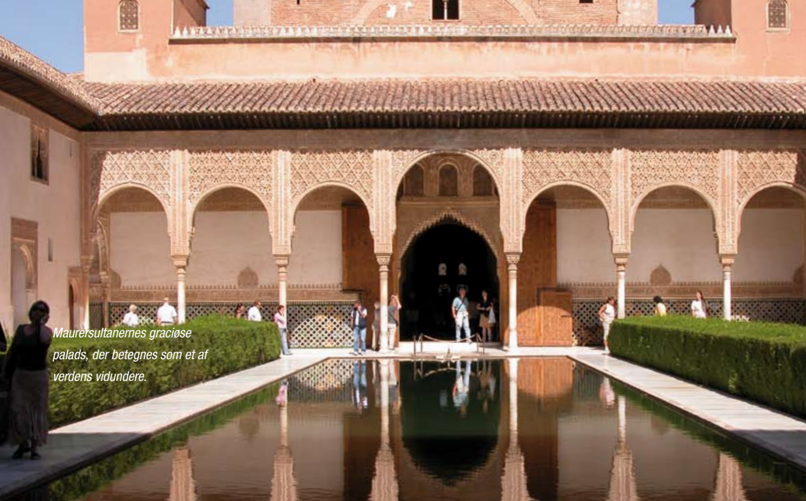
Maurensultanernes graciøse palads, der betegnes som et af verdens vidundere.